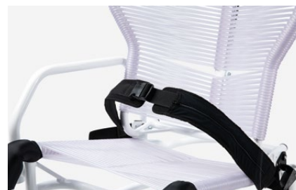
894 Cintura pelvica a 45°