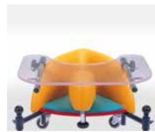
824 - tavolo trasparente con incavo

Ric. al Cod. ISO indicativo 12.06.09.136